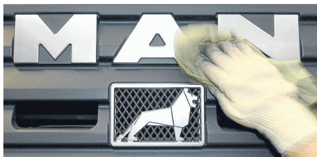
Polieren am Firmenimage: MAN hat die Schmiergeldaffäre durch die Zahlung von 151 Millionen Euro Bußgeld beendet. Doch die Verfahren gegen Mitarbeiter laufen weiter.